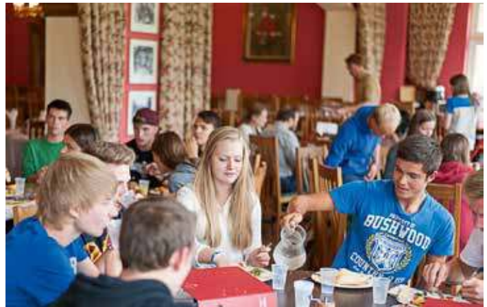
LINKS: Spielend die Sprache zum Einsatz bringen.